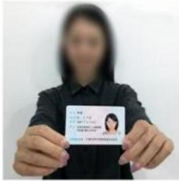
手持身份证照片示例